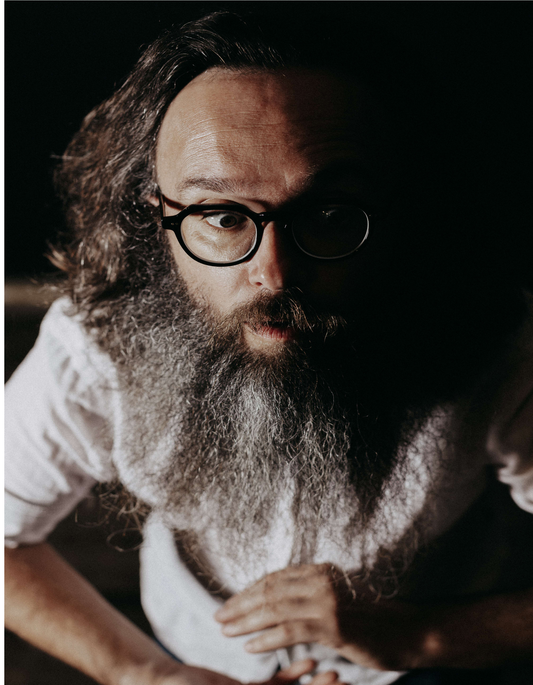
Aurélien Delsaux / VPL Photographie