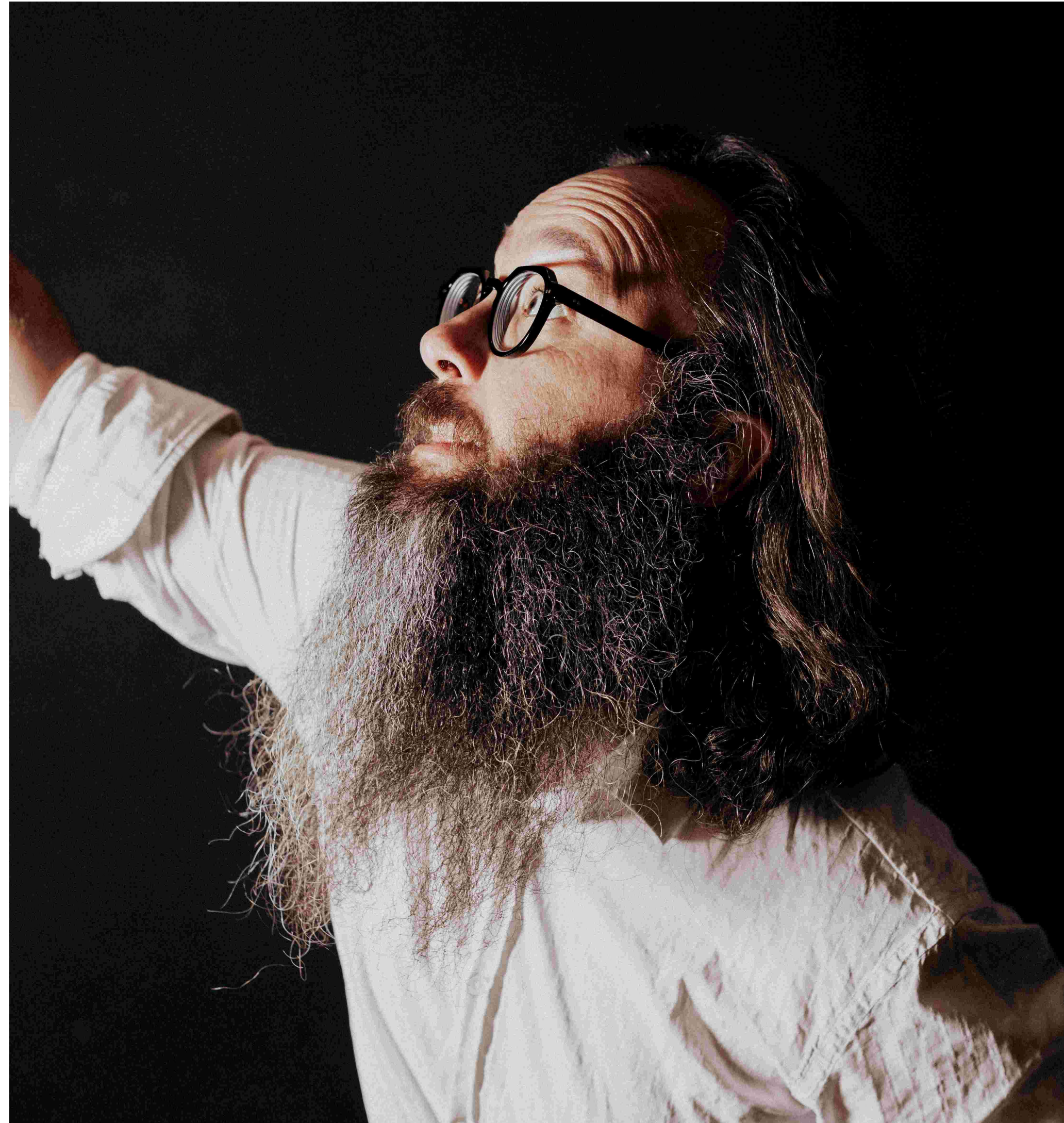
Aurélien Delsaux / VPL photographie