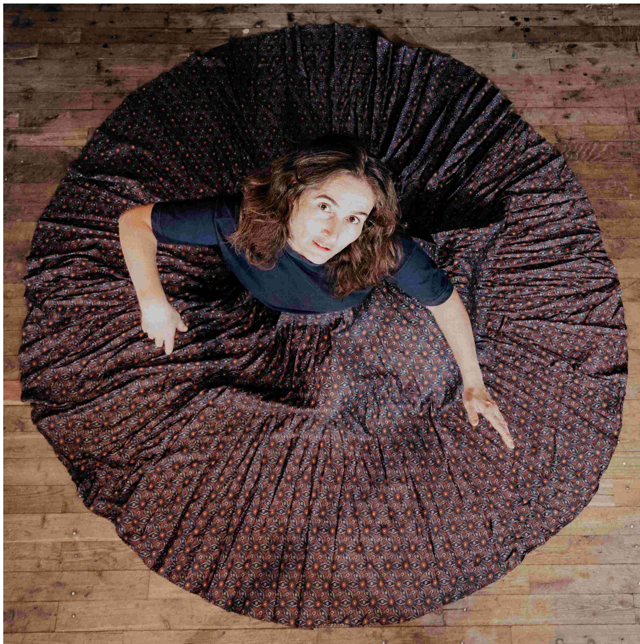
Jeanne Guillon / VPL Photographie