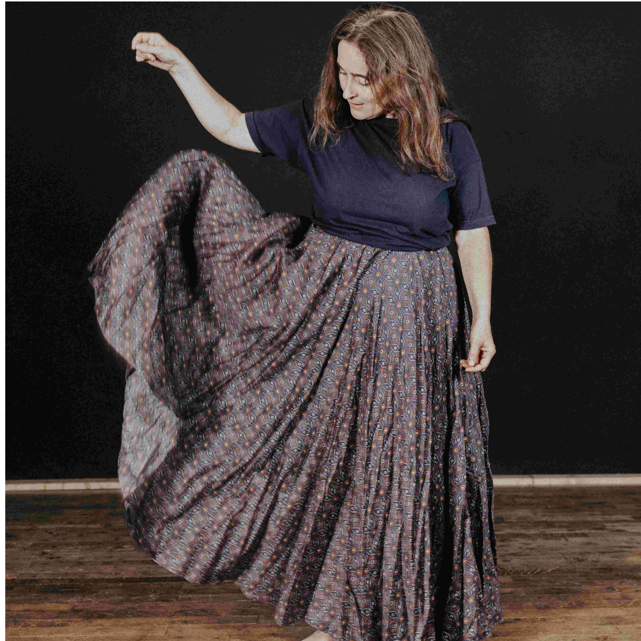
Jeanne Guillon / VPL Photographie